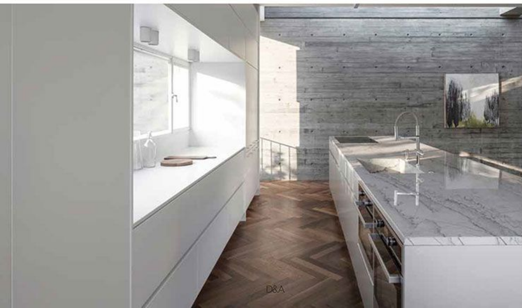
אזור המגורים הפתוח לנוף הגינה.